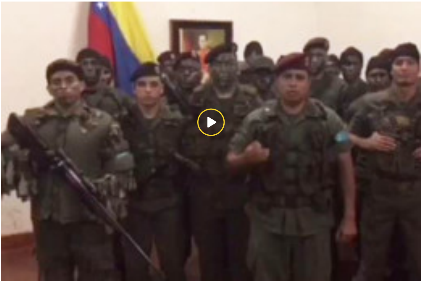
In Venezuela tenta la rivolta anti Maduro: arrestati